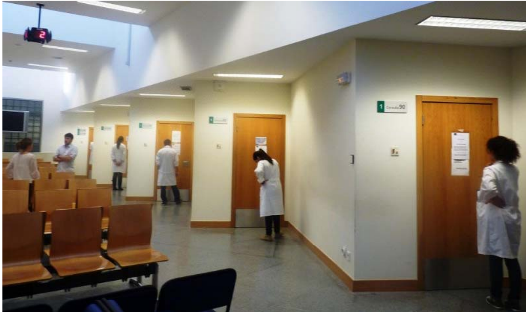
ECOE. Seminario Hospitalario. Hospital Universitario Infanta Cristina Badajoz. Febrero, 2016