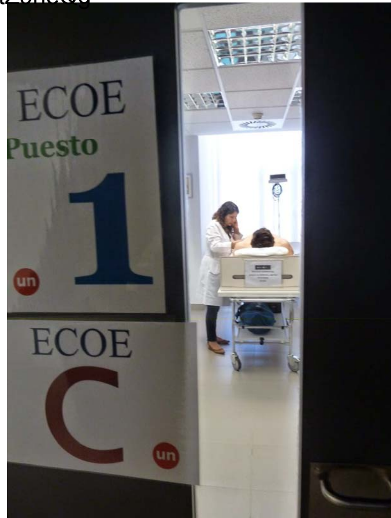
ECO E. Seminario Hospitalario. Hospital Universitario Infanta Cristina Badajoz. Febrero, 2016

https://www.youtube.com/watch?v=bnlmtZ9neQg