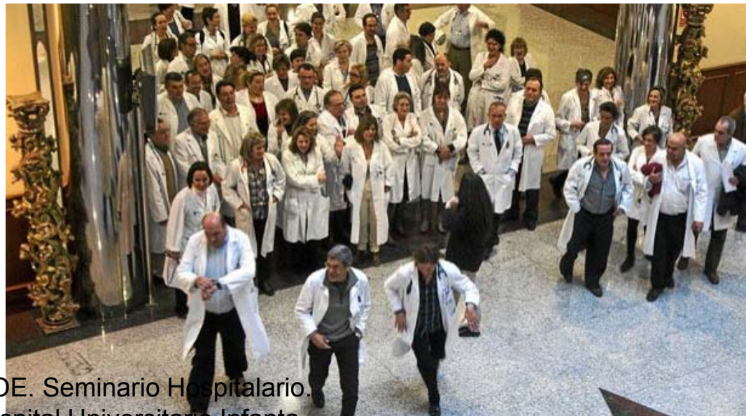
ECOE. Seminario Hospitalario. Hospital Universitario Infanta Cristina Badaioz Febrero 2016